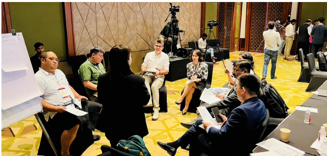
Review of Implementation of the APTLD Policy Statement “Internet for all” 場次分組討論 1

Digital Transformation and the Role of ccTLDs 場次邀請 NIXI (.IN)、ISOC AM (.AM)、BTCL (.BD)、.LK Domain Registry (.LK)、NIC.CZ (.CZ)分享 ccTLD 在世界快速變化的需求中該有的數位轉型策略及作為。