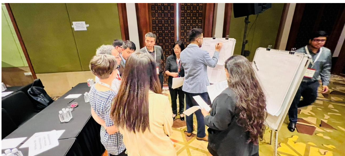
Review of Implementation of the APTLD Policy Statement “Internet for all” 場次分組討論 2

APTLD 下次會議將於 2024 年 9 月 18-19 日於越南峴港舉行，相關會議資訊可參閱: https://aptld.org/ 。